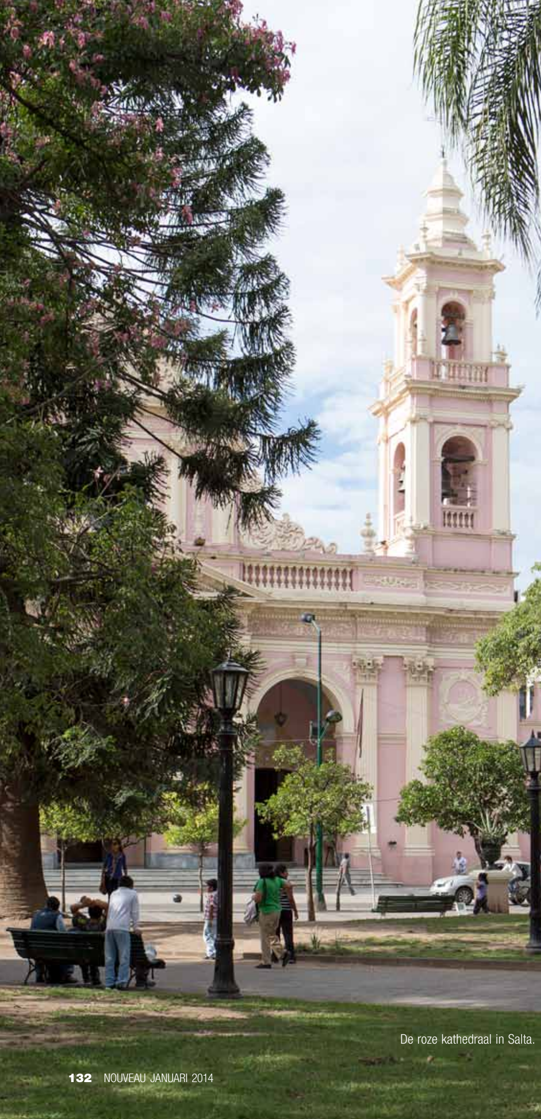
De roze kathedraal in Salta.